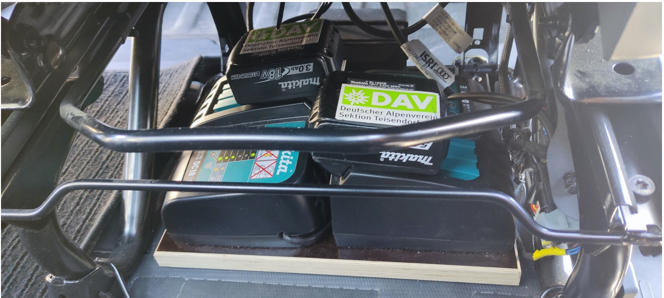
Abbildung 1: Akkus in den Ladegeräten unter dem Fahrersitz

Die Akkus werden automatisch während der Fahrt geladen (Motor muss laufen), daher die Akku nach der Nutzung wieder in die Ladegeräte unter dem Fahrersitz einlegen (Siehe Abbildung 1).